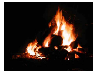
Početak u 17 Sati !!!!

Ovo se sprema za svakog ko dođe već u petak!