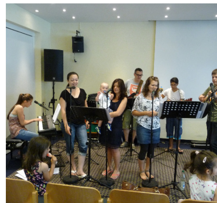
Muzički Team Mladih

Blagoslovljene Božićne praznike i srećnu Novu 2015. godinu želi vam Odbor.